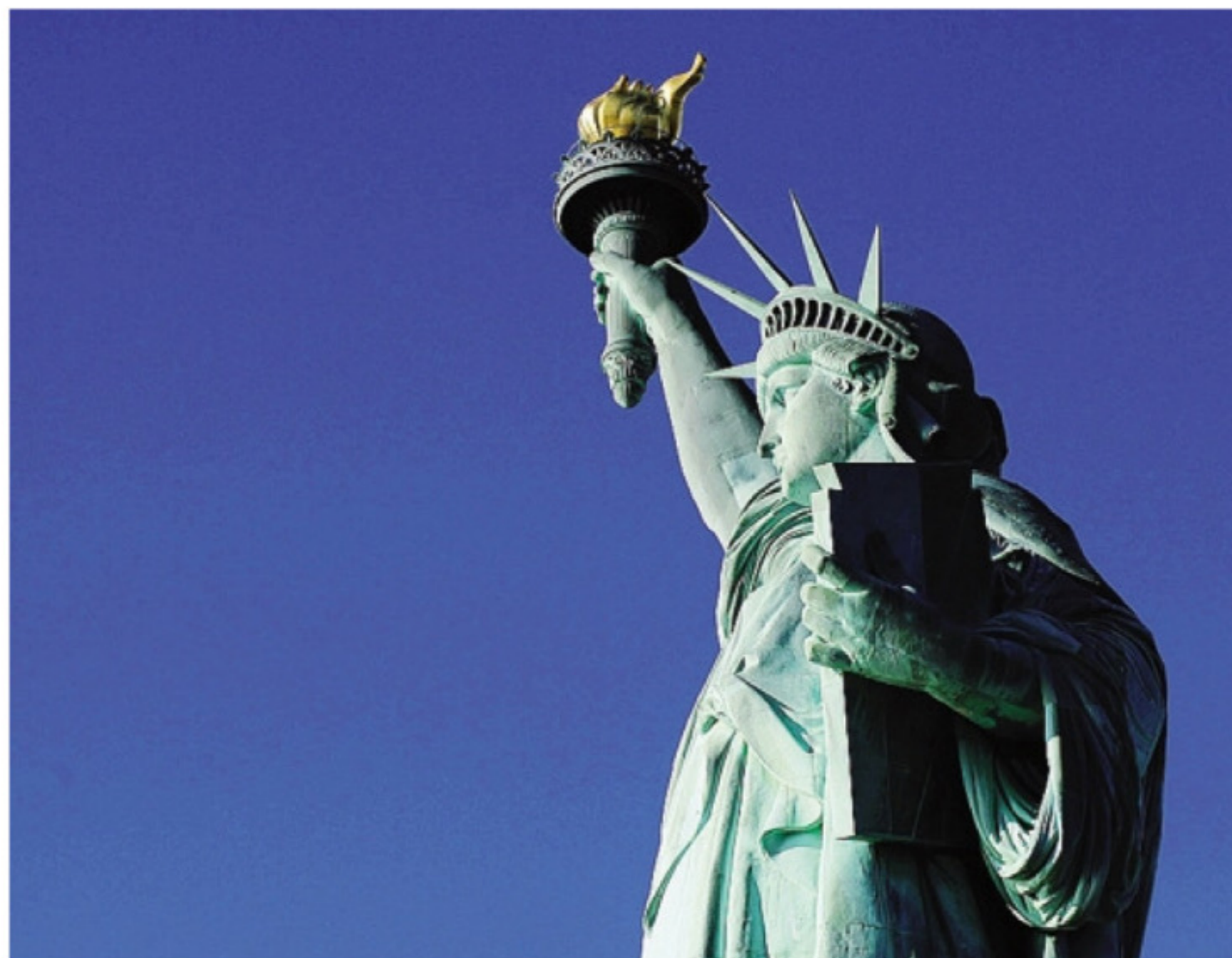
La statua della libertà campeggia sulla copertina del libro «Non scuola ma scuole» (Edizioni Studium)

In ogni caso, l'edizione italiana di «Non scuola ma scuole» vorrebbe contribuire a riaprire una questione che nel nostro Paese pare essere stata rimossa - o quasi - dall'agenda politica, come spiega Giuseppe Bertagna, vicepresidente di