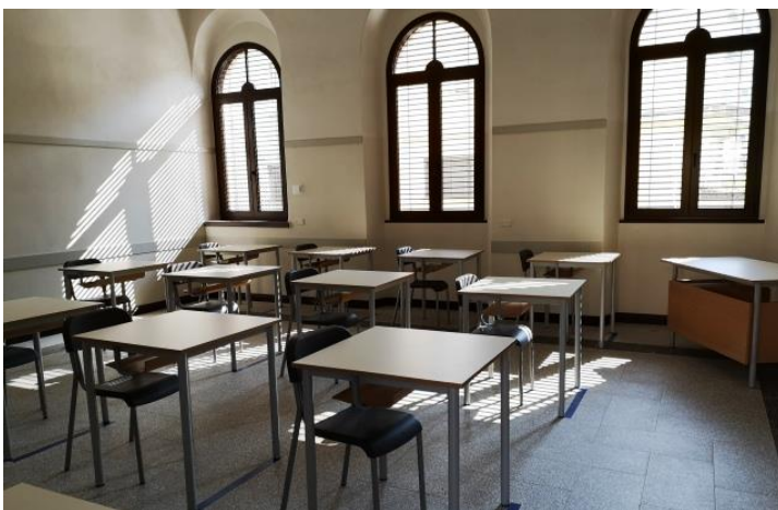
Gallarate liceo sacro cuore – MALPENSA24